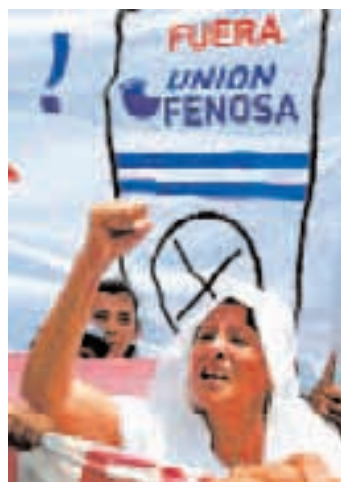
NICARAGUA, 2006. Protesta contra Unión Fenosa en Managua.

En la década de los 90, a raíz de la creación del Mercado Único Europeo y la consolidación del marco económico neoliberal (Consenso de Washington), se produce un proceso de apertura e