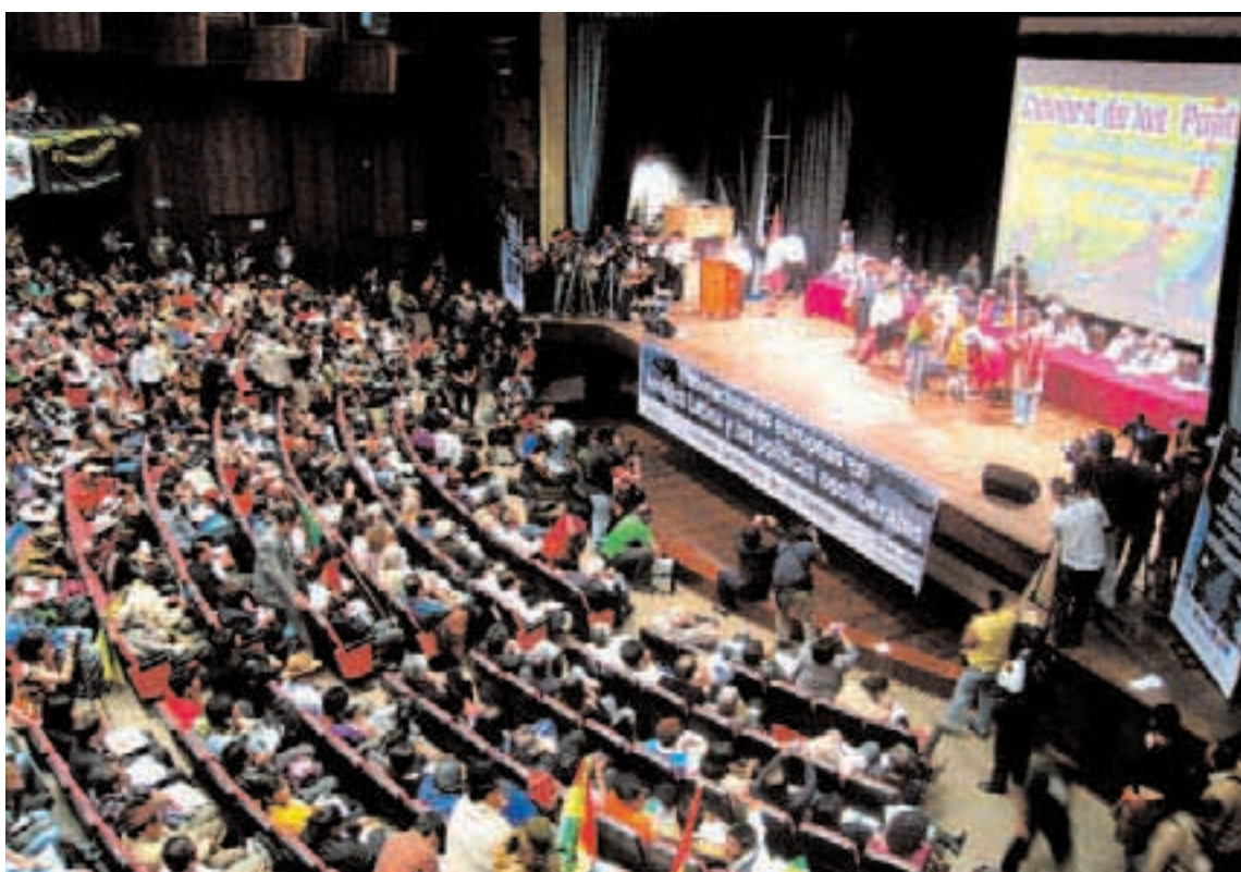
LIMA, 2008. Sesión de la Cumbre de los Pueblos Enlazando Alternativas III en la capital peruana.

El tribunal de Madrid sigue la senda de las dos sesiones anterior-