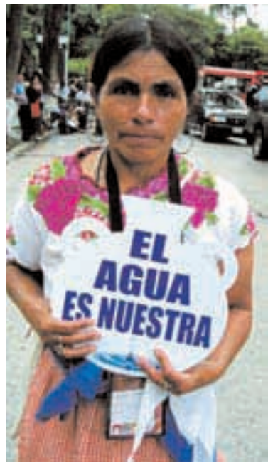
AGUA. Los TLC de la UE incluyen la privatización de servicios públicos básicos.

La presencia de delegaciones de América y Europa requiere del apoyo de todas y de todos. Se está creando una red de casas solidarias. Y se ha organizado un equipo para resolver las incidencias que puedan surgir en