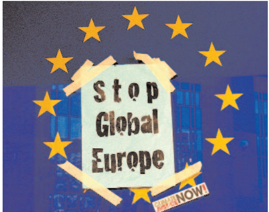
JUSTICIA CLIMÁTICA. La Presidencia española se enmarca en plena crisis económica, energética y climática.

La gran medida contra la crisis consiste en la puesta en marcha de organismos para regular los mercados financieros, aunque carece todavía de concreción y no parece que esté diseñada más que para contro-