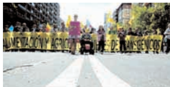
ZARAGOZA, ABRIL 2009. Manifestación contra los transgénicos.

El encuentro estatal "Activ@s contra la crisis" convoca una jornada de lucha y movilización, impulsando, entre otras acciones, marchas contra el paro, la crisis y el racismo, desde diferentes puntos de la península rumbo a Madrid.