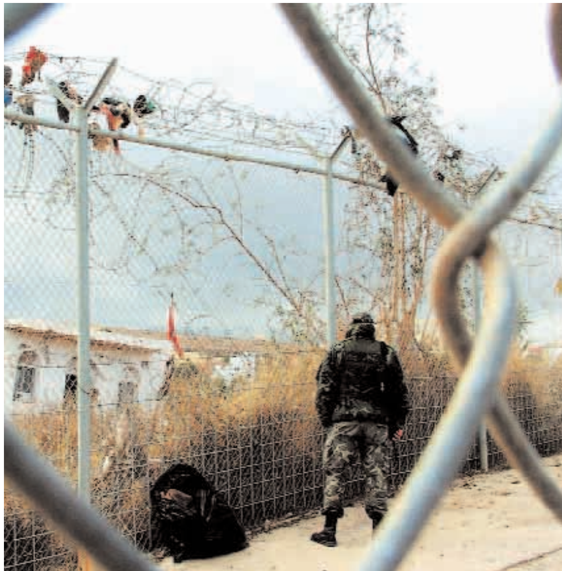
LA VALLA DE LA VERGÜENZA. La militarización de la frontera ha sido la reacción de la UE frente a la presión migratoria.

La Unión Europea lleva tiempo dominada por dos obsesiones: la defensa acérrima de la libre circulación de mercancías, capitales y servicios y la apuesta por políticas monetaristas que erradiquen la inflación y el déficit. Esas obsesiones, por miedo o por convicción, han sido asumidas por la mayoría de los Estados miembros, sobre todo en la eurozona. En ese contexto, sólo cabe concluir que el modelo económico impulsado por la UE es una amenaza en toda regla a los derechos sociales en el interior de los Estados y un obstáculo para el surgimiento de políticas sociales y ambientales robustas a escala europea.